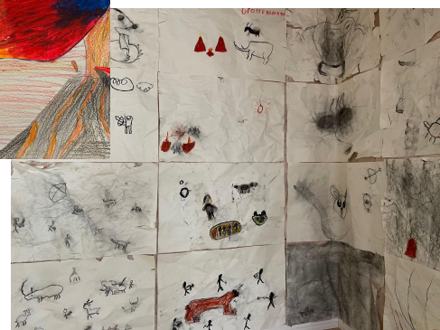
Grottekeningen (gr 5)